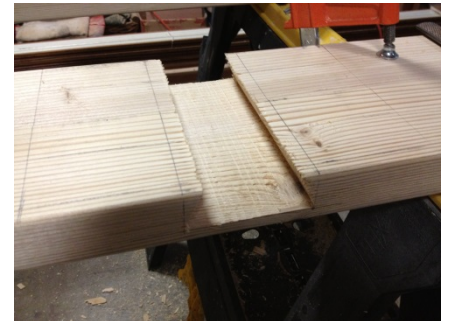
Traçage du second tenon de chaque pied. Les pieds sont 2 2"x6" (4cm x 14cm)