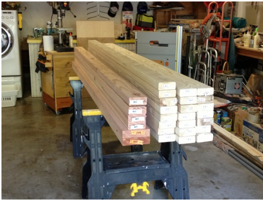
Achat du bois